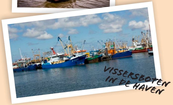
VISSERSBOTEN IN DE HAVEN

NATIONAAL PARK LAUWERSMEER Het afsluiten van de Lauwerszee in 1969 creëerde één van de mooiste natuurgebieden van Nederland, het Nationaal Park Lauwersmeer. Meer info over Nationaal Park Lauwersmeer: www.np-lauwersmeer.nl