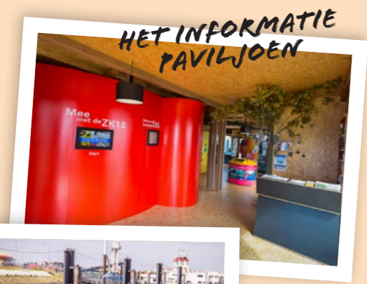
HET INFORMATIE PAVILJOEN