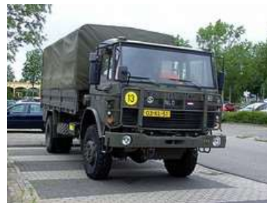
vrachtauto DAF YAP