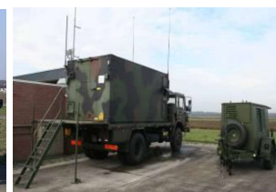
vrachtauto + aanhanger